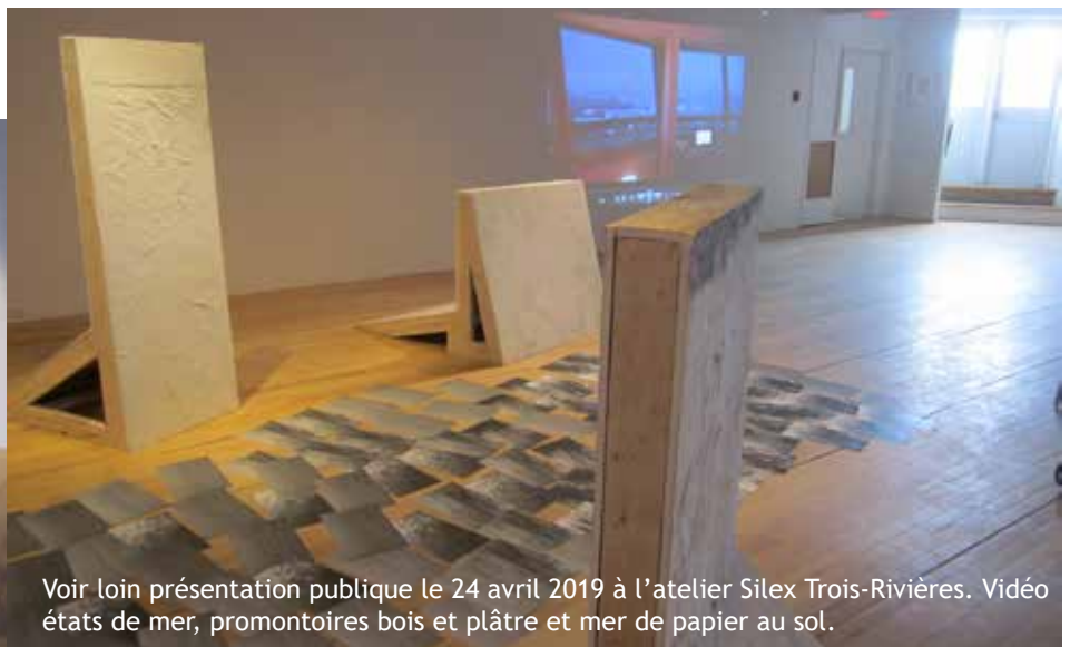
Voir loin présentation publique le 24 avril 2019 à l'atelier Silex Trois-Rivières. Vidéo états de mer, promontoires bois et plâtre et mer de papier au sol.