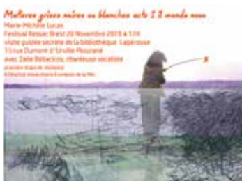
Matières grises noires ou blanches acte 1 il mondo novo Marie-Michèle Lucas Festival Ressac Brest 20 Novembre 2019 à 17h Visite guidée scientifique de la Bibliothèque Lapérouse 13 rue Dumanoir à Plouzané Plouzané avec Zalie Bellaccicco, chanteuse lyrique action de médiation