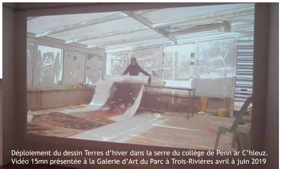
Déploiement du dessin Terres d'hiver dans la serre du collège de Penn ar C'hleuz. Vidéo 15mn présentée à la Galerie d'Art du Parc à Trois-Rivières avril à juin 2019