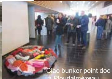
Ciao bunker point doc à Ploudalmézeau