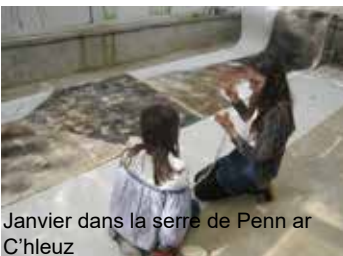
Janvier dans la serre de Penn ar C'hleuz