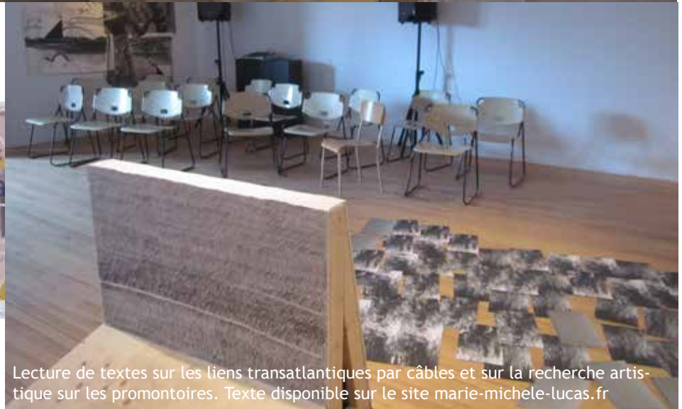
Lecture de textes sur les liens transatlantiques par câbles et sur la recherche artistique sur les promontoires. Texte disponible sur le site marie-michele-lucas.fr