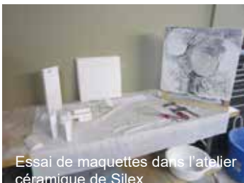
Essai de maquettes dans l'atelier céramique de Silex