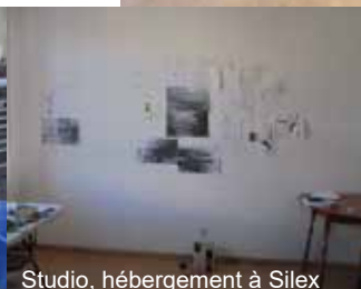
Studio, hébergement à Silex