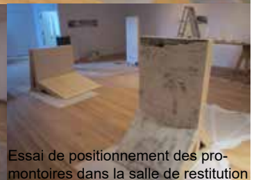
Essai de positionnement des promontoires dans la salle de restitution