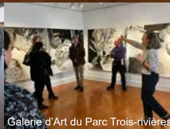
Galerie d'Art du Parc Trois-rivières